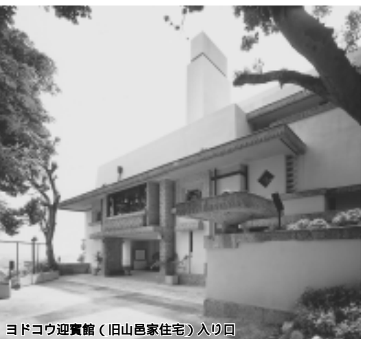
ヨドコウ迎賓館(旧山邑家住宅)入り口

外来担当医表や各診療科のご案内等を掲載しています。ぜひご活用ください。 <ホームページアドレス> http://www.hosp.city.ashiya.hyogo.jp/Top/index.htm 問い合わせ 芦屋病院総務課管理係 ☎31-2156