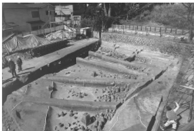
金津山古墳前方部を発掘調査 今回の調査では、前方部の西側半分をほぼ全面発掘。本墳は帆立貝形前方後円墳であることが判明し、埴輪・須恵器・葦石が多数出土した。また、南北朝時代の遺構もみつかった。

発行 / 芦屋市役所(広報課) ☎0797-31-2121 〒659-8501 兵庫県芦屋市精道町7番6号 ホームページ http://www.city.ashiya.hyogo.jp/ メールアドレス info@city.ashiya.hyogo.jp