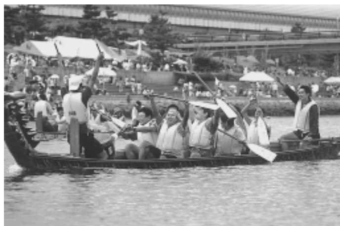
第6回 ASHIYA CUP ドラゴンボートレース大会 ドラゴンボートレース大会が7月30日に南芦屋浜水路で開催されました。小学生から大人まで約1,000人が参加、約2,000人の観客が見守る中、熱戦を繰り広げました。