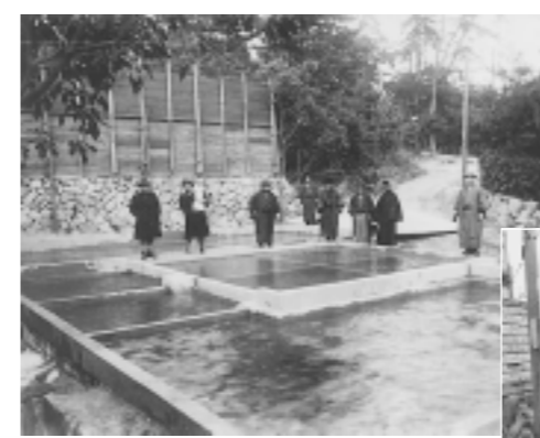
竣工時の山芦屋水道組合の浄水施設

私たちは、阪神・淡路大震災の時、生活に欠くことのできない水の重要性を目の当たりにしました。今から七十年前、芦屋地域を含め異常な洪水に見舞われました。人口増加に伴って井戸水もしいに水量を減じ、水不足は村の難問題でした。村では上水道施設の計画を立てましたが、用地買収や工事費の折り合いがつかず、実現しませんでした。そのため、個人あるいは小規模な組合組織による簡易水道の建設が試みられました。 例えば、山芦屋水道組合が昭和五年四月に竣工した上水道施設は、現存する唯一の物です。この上水道施設は、高座川の支流、山手中学校校庭の北東端より五メートル上流で取水し、山芦屋町六番地に浄水施設を置き、山芦屋町や西山町の約二百戸、千人に給水していました。浄水施設には、着水池・濾過池・浄水池を配し、配水管に消化栓を設置するなどの設備が施されました。その後、芦屋市が高座川浄水池を建設するにあたり、山芦屋水道組合は水利権を解消しました。