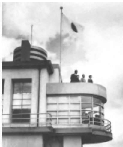
旧山手小学校の象徴とも言われた三層からなる塔屋(展望台)。美術博物館で写真を展示中。新校舎でもデザイン的に継承された展望室が設置されています。