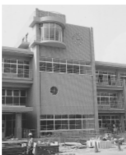
新学舎に向けて進む、建替工事(7月26日)

施設の老朽化のため、建替工事中の山手小学校が八月三十一日に完成します。工事期間中は、旧三奈小学校校舎を使ってきましたが、いよいよ九月一日の二期から新校舎に移ります。平成十一年四月の、校舎建替えに伴う旧三奈小学校校舎への移転後、およそ一年五カ月ぶりにもこの場所に居ることになります。 今回の工事は、校舎の部分建替えで、給食棟や体育館は既存の施設を引き続き利用します。