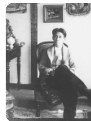
アトリエでの小出楯重(1928年)

近代日本の洋画家の中でも高く評価されている芦屋ゆかりの画家小出楯重をテーマに美術講座を行います。終回には京都国立近代美術館で開催されている「小出楯重回顧展」を見学し、モダニズムの時代を生きた画家の全貌にせまります。