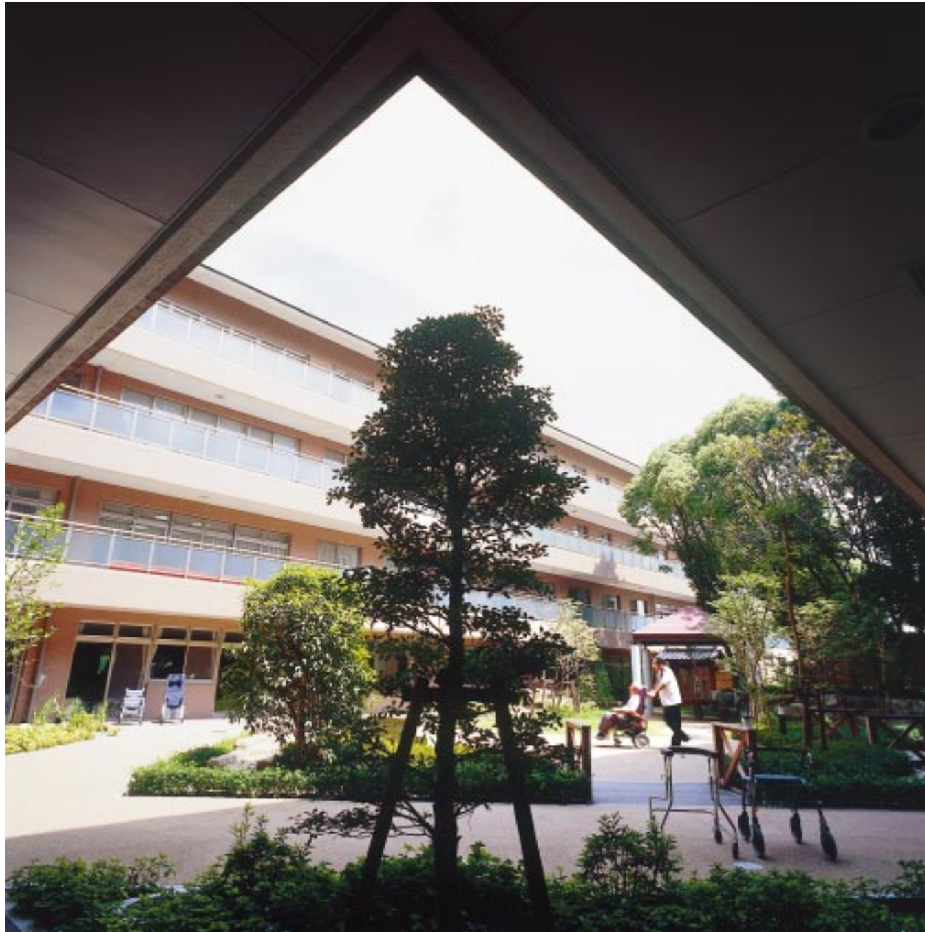
演出/大森一樹(映画監督) イラスト/なかにし和子

発行 / 芦屋市役所(広報課) ☎0797-31-2121 〒659-8501 兵庫県芦屋市精道町7番6号 ホームページ http://www.city.ashiya.hyogo.jp/ メールアドレス info@city.ashiya.hyogo.jp