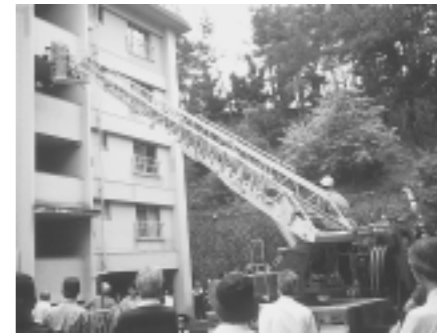
はしご車による避難訓練

の計画など地域の防災意識の推進を計ってまいりました。特に高齢化社会に向け、住民を対象に緊急連絡先の調査を実施し名簿を作成したり、救急救命ライセンス講習会を開催してまいりました。地域ぐるみの活動として、朝日ヶ丘町、東山町自主防災会にも声をかけ、はしご車による救出訓練、消火器取り扱い訓練、簡易トイレの組み立て訓練などを実施し、組織の強化を推し進めることができました。今後も自主防災においてさまざまな体験と訓練を重ね、地域の防災意識の高揚に務めて参りたいと思います。