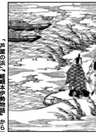
問い合わせ 美術博物館 ☎38-5432

先頃 美術博物館で「伊勢物語と芦屋」展が開催されました。芦屋が登場する『伊勢物語』の第八十七段を中心に写本、絵巻、屏風など伊勢物語文化の広さを紹介しました。 そこには「潮汲み女」「螢火」「沖の漁り火」といった歌名所としての芦屋の姿が記されていました。いずれも、地域景観に密着した側面が記されていたと考えられ、特に「螢火」「沖の漁り火」などは、それらが歌え取りあげられるほど芦屋の夜は漆黒の間であった、ということに他ならないのです。 業平が本当に芦屋に暮らしたかは定かではありませんが、『伊勢物語』を通じて、芦屋の里が歌名所の地として、またこの地を見たことのない人にとっても、あるイメージが定着したことは疑うべくもありません。 すなわち、浜辺の景色、業平と芦屋、漁り火、海人、田舎人というイメージです。まさしく、業平ら都人にとって芦屋の里は鄙びた海浜地帯で、そこに暮らす人々は田舎人に他ならなかったのです。 そして、『伊勢物語』の普及を考える際に最も影響力があった、『嵯峨本伊勢物語』に物寂しい「芦屋の浜」が挿絵で挿入されたことにより、そのイメージは決定的なものとなったのです。