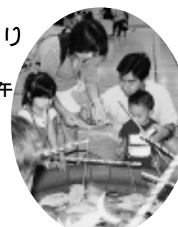
昨年の夏まつりの様子

日時 8月18日(土) 午前10時30分～正午 会場 宮川小学校体育館 内容 伝承あそび、魚つりゲーム、玉入れ、釣あて等 持ち物 ビニール袋(靴入れ)