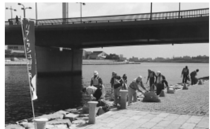
第31回春のわがまちクリーン作戦 6月17日、ごみのない快適なまちづくりを目指してクリーン作戦を実施。市民の皆さんなど約1,400人の参加者が合計4,510キログラムのごみを収集しました。

☎0797-31-2121 〒659-8501 兵庫県芦屋市精道町7番6号 ホームページ http://www.city.ashiya.hyogo.jp/ メールアドレス info@city.ashiya.hyogo.jp