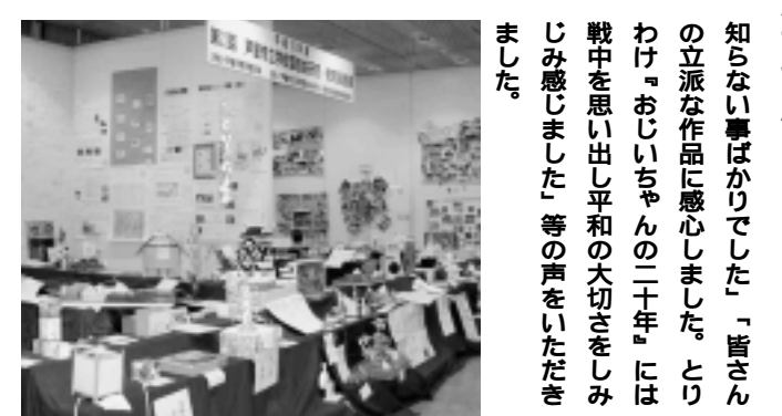
知らない事はかりでした。皆さん

自由研究発表大会では、永久磁石によるリニアモーターカーの模型、芦屋川の研究などが大変わかりやすく説明されていました。 アンケートには「この作品もよくできていてびっくりしました。いろいろなアイデアの詰まったものだと思います。私にもできないものが