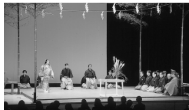
第11回 芦屋能・狂言鑑賞の会 11月30日、ルナ・ホールで文化振興財団主催による「芦屋能・狂言鑑賞の会」が満席の中、開催されました。

市役所は、年末は二十八日(金)午後五時十五分まで、年始は一月四日(金)午前九時から業務を行います。 例年同様、窓口など大変混雑しますので、ご利用は早めにお済ませください。また、年末年始は、ごみの収集日が通常と異なりますのでご注意ください。 休業期間中も、出生届などは市役所直室で受け付けています。 年末年始の問い合わせは、市役所代表電話 ☎ 21-2118。