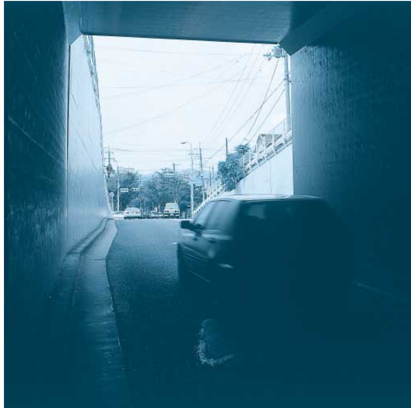
演出 / 大森一樹(映画監督) イラスト / なかにし和子

☎0797-31-2121 〒659-8501 兵庫県芦屋市精道町7番6号 ホームページ http://www.city.ashiya.hyogo.jp/ メールアドレス info@city.ashiya.hyogo.jp