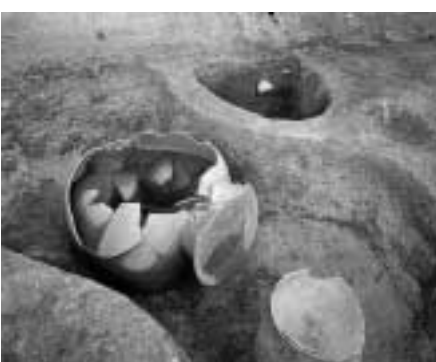
市内最大の土器発掘 寺田遺跡山手幹線予定地出土 古墳時代中期(5世紀) 直径65cm、高さ75cmを測る大きさの市内最大の土器がほぼ完全な形で見つかりました。

「寺」の字が刻印された鉄鉢形の須恵器は二つの生産地に分かれるよううで、律令期の地方寺院が必需品の調達に際して、専用の器を特別発注するなど、かなりインシニアティブをとっていたことがわかって興味深いです。