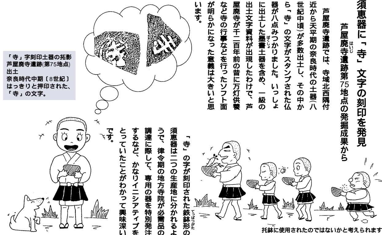
「寺」字刻印土器の拓影 芦屋発掘75地点出土 奈良時代中期(8世紀)はつきりと捺印された、「寺」の文字。