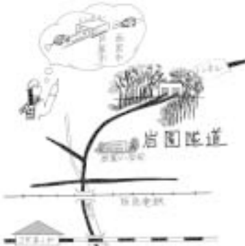
岩園隧道 - トンネルを抜けると...

通称「岩園トンネル」とも言われる岩園隧道。隧道のほぼ中央が西宮市との市境。昭和30年代から始まった岩園町の開発を受け、昭和46年に完成。