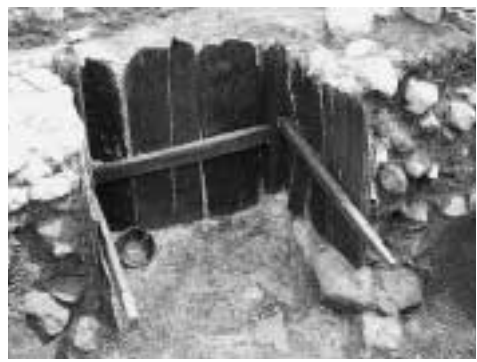
地下2mのところから出土した木組みの井戸跡 六条・清水遺跡出土 平安時代後期(12世紀) 扇状地の端でコンコンと湧き水が出てきました。

清水公園の建設に伴って実施された発掘調査では、「清水町」の町名の起源ともかかわる清い水の湧く古代の井戸が発掘されました。井戸は縦板と横木によって四角形に組まれたもので、底からは十二世紀初頭の土器がみつかりました。中には字の書かれたものもあり、平安時代終わり頃約八百年前の井戸にまつる信仰や祭のようすを知ることができました。また、自然科学分析により、古代当時の生活環境、植生、さらに微生物化石なども色々と調べることが