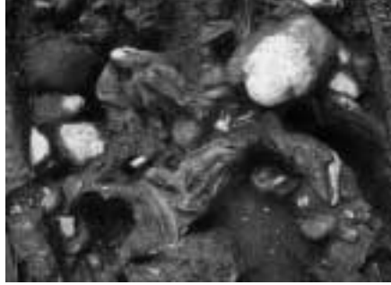
堤の中から大量に出土した牛の骨 若宮遺跡出土 南北朝時代(14世紀) 宮川東岸の若宮地区の発掘で、解体された牛骨と土釜などの土器類が大量に出土し、堤の盛土に含まれていることがわかりました。

ら縄文時代の遺跡がみつかり始めました。今回の調査もその一つで、いくつかの調査成果を合わせて考えると、芦屋川西方の六甲山南麓一帯に縄文時代の大きな遺跡が埋没しているものと思われる