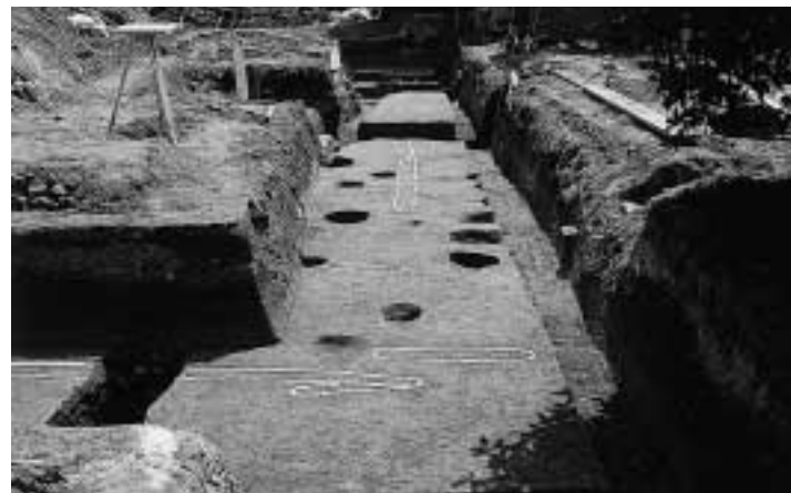
牛耕の痕跡 津知遺跡出土 鎌倉~室町時代(13~14世紀) 白線で記した細長い溝が、牛が引いた犁の痕跡です。耕作地の区画に沿って、平行もしくは直交して走っています。

津知町全域に分布する津知遺跡では、区画整理事業に伴って多くの発掘調査が実施されており、古墳時代から中世(三~十六世紀)の耕作地跡がみつかっています。耕作地跡には牛が引いた犁によって耕された痕跡が