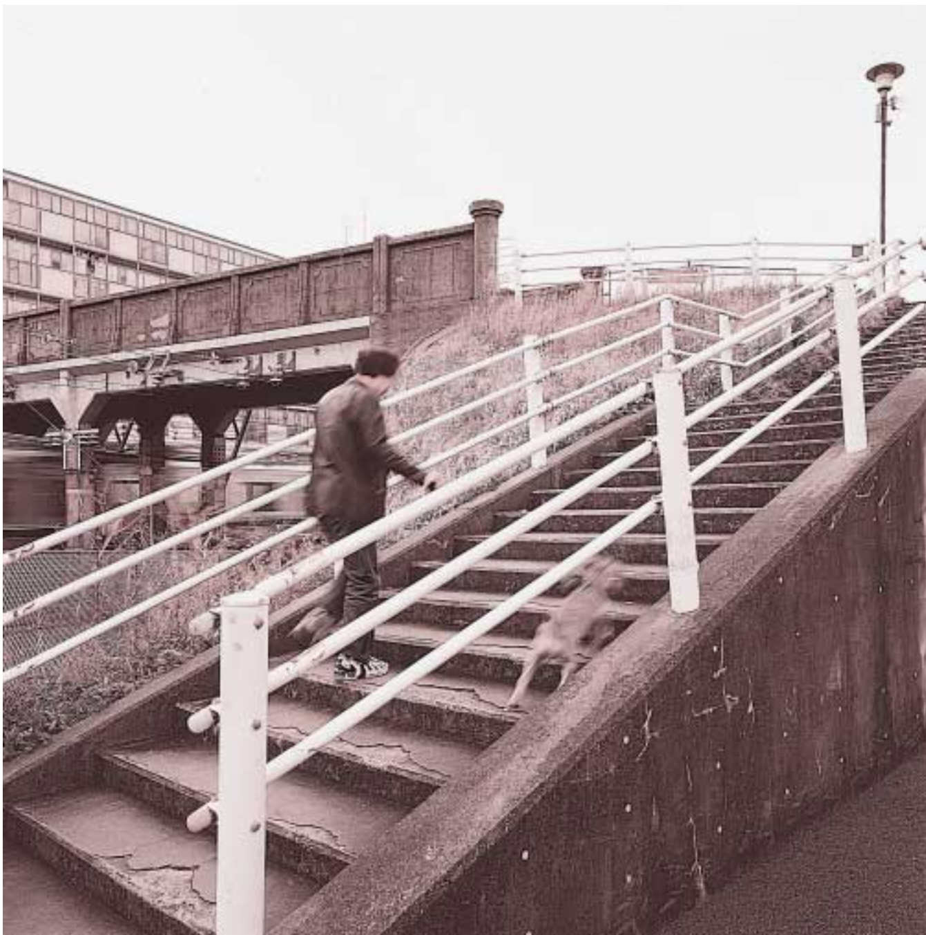
演出 / 大森一樹(映画監督) イラスト / なかにし和子