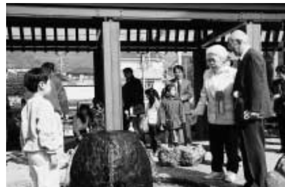
清水公園オープニングセレモニーの様子

現在芦屋西部地区では、震災復興土地区画整理事業が行われている。事業は、前田町・清水町を第一地区とし、津知町と川西町の一部を第二地区として行われている。清水公園は公園のなかった第一地区に設けられた。