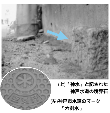
(上)「神水」と記された神戸水道の境界石 (左)神戸水道のマーク「六剣水」

上ヶ原送水路の鉄管(直径八十四センチ)埋設に伴って、多くの土地が買収されました。当時、精道村でも現岩園町・東山町・東芦屋町・西山町・三条町などの土地約三千八百坪が買収されました。 三条町には、その境界を示す花崗岩の石柱が残っています。石柱には「神水」と記されています。この石柱は西山町でも確認されています。また、神戸水道が埋設されている道路には、水の字を図案化した、「六剣水」のマークも見ることが出来ます。