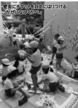
壁面にチケットを自由にはりつける「かぜはなびくかべ」

本館に隣接する伊勢幼稚園とは、年間数回にわたって連続的に造形活動を行っています。今年度の第一回目は「いせようちえんとびはくをむすぶ」。美術博物館という楽しい場所がすぐ近くにあることを知ってもらったため、両施設を隔てているフェンス越しに、直径五十センチ、長さ三百五十センチの紙筒を立て掛けます。園児はこのすべり台を通って本館の庭へあそびに来る、というものです。その二日後には、本館裏側の壁面に不要になった展示会チケットを貼り付けていきます。何枚ものチケットが風を受けてなびく様子を園児たちは「かぜのかたがみえる」と喜んでいました。