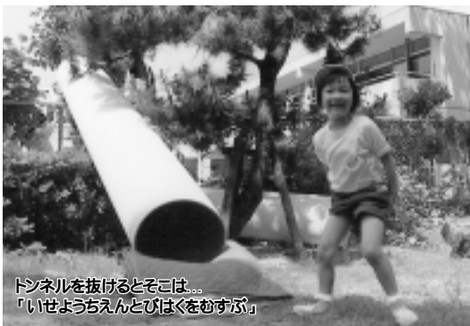
トンネルを抜けるとそこは... 「いせようちえんとびはくをむすぶ」