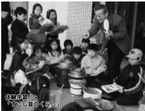
体験学習「すこし昔の暮らし」

小学三年生で学習する「人びとの暮らしのうつりかわり」(社会科副読本)「わたしたちのまち(芦屋)」に合わせ、昭和三十(四十)年代に使われていた生活道具を実際に見て、触り、使い方を学び、体験学習を毎年行っています。子どもたちは、普段は展示ケースに入っている道具を直接手で触り、体験で