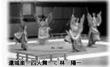
還城楽・四人舞

の国際会議開会式に舞楽を頼まれ出演した。見応えのある舞をとの主宰側の要望に、海外公演でも人気のある「 還城楽・四人舞 」を舞った。「 還城楽 」はもともと、恐ろしい造り物の蛇を持つて独