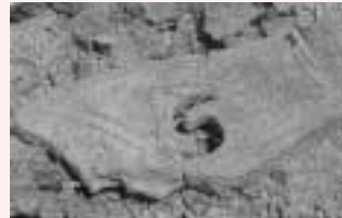
緑彩色の形象墳輪(打出小槌古墳出土)

また、五世紀末までに築造された打出小槌古墳(打出小槌町)は、同時期では阪神間最大の前方後円墳で、グレートの高い形象墳輪がみられませんが、日本では珍しい緑彩色の墳輪が出土しています。九州の初期装飾古墳