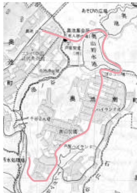
奥池グリーンロード(全長2.51km)