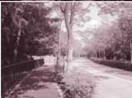
芦有道路奥池ハイランド南進入路交点～(奥池を経由)～芦有道路交点