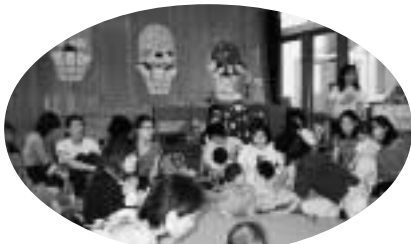
岩園保育所・子育て広場