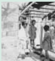
上の写真は、前田町のかたから寄せられた資料です。築山の周辺から撮られたものと思われる。園内を見取図(下図)は、寄せられた思い出や写真から、復元したものです。

園内には五メートル前後のトロッコ列車や、門構えも立派なリス小屋、ぶら下がって遊ぶ「うんてい」やコンクリート管内に固定された椅子、石が埋め込まれた築山などが設置され、子ども達の探検心を誘うような工夫に富んだ所だったようです。