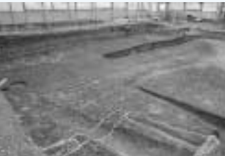
前田遺跡出土の市内最古の稲作農耕跡良好な畦を残している(紀元前5世紀)

いた弥生時代前期の土器片とも年代が大きく矛盾するものでないことがわかりました。芦屋川の流域でみつかったこの水田は、今のところ芦屋の先住者が最も早く稲作農耕を始めた証拠として歴史的に注目されます。市公園緑地課では、前田公園内に遺跡を啓発する説明と弥生人の足跡を原寸大で復元した碑をつくり、周辺の市民に親しまれていきます。