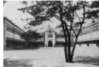
新築の精道小学校校舎(大正8年建築)

市制施行50周年の平成2年11月10日に、市が編集・発行した記念写真集「芦屋今むかし」「芦屋のうつりかわり」の在庫本を、11月15日から行政情報コーナー(市役所北館1階)で頒布します。