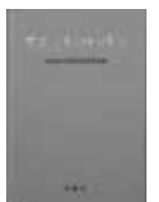
「芦屋のうつりかわり」