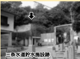
三條水道貯水施設跡

三條南町三十六番地付近では、上流から勢いよく送られてきた水がサイフォンの仕組みで地上約五メートルの貯水タンクに吹き上げられ、そこから三條南町の一部の地域に配水されてきました。