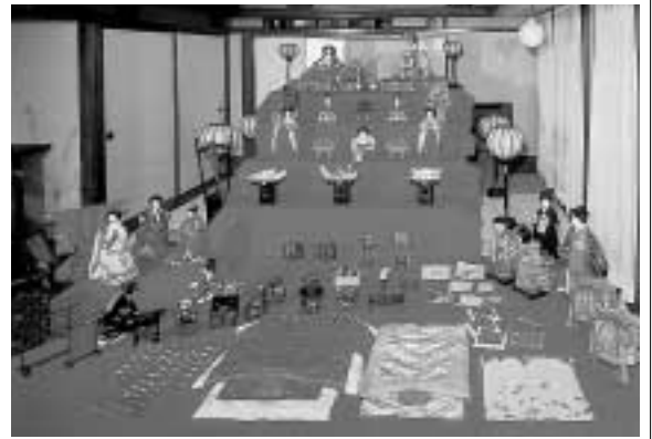
ヨドコウ迎賓館で難人形展 2月14日~4月11日

国指定重要文化財で、F.L.ライト設計の当館では、今春も建築主・山邑家伝来の難人形展を開催します。期間中は、月・木曜日(休館)を除く毎日、午前10時から午後4時まで公開。古の雅をご堪能ください。入場料 一般・大学生500円 小学生~高校生200円 館内の撮影はお断りしています。ご了承ください。問い合わせ ヨドコウ迎賓館 ☎38-1720