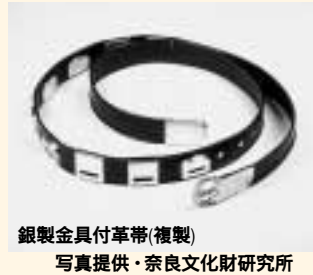
銀製金具付革帯(複製)

位階の象徴ともいえる石製の断片を記念品的に広く所持していたとみる考えもあり、有位者と関係づけられる人びとが特定のエリアに住んでいたと想像できることは大変興味深いです。ちなみに、約一万人の官人が居住していたといわれる平城京からは約二五〇点の帯金具が出土しています。