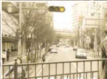
上宮川橋西交差点～大正橋東交差点・芦屋川左岸線交差点