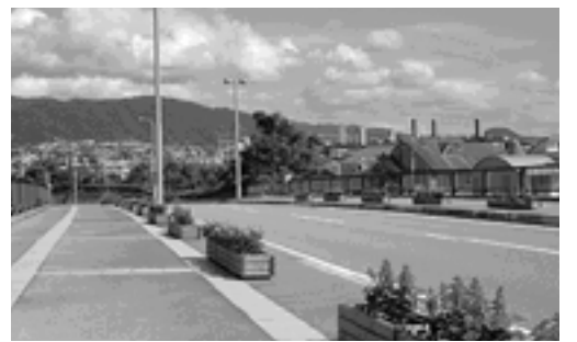
のじぎく国体会場周辺 ~花の道~

のじぎく兵庫国体も、いよいよ本番スタート。 カヌー競技会場となる芦屋キャナルパークへの道路沿いや潮風大橋、またライフル射撃会場の兵庫県警察学校(朝日ヶ丘町)周辺には、市民の皆さんが花苗から育ててくださったフラワーボットが沿道を飾り、訪れる人を歓迎し、大会の成功をサポートしてくれています。 芦屋の緑ゆたかな街並みと、心のこもった沿道の花々は、きっと全国から訪れる選手や関係者、また観戦に訪れる人々の心に、芦屋と国体の美しい思い出を刻んでくれることでしょう。