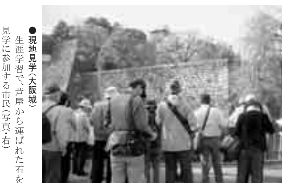
●現地見学(大塚城) 生涯学習で、芦屋から運ばれた石を見学に参加する市民(写真右)

このように、地域住民にとって身近で利用しやすい学習活動の拠点として、図書館、公民館、美術館、博物館、体育館をはじめとする様々な生涯学習施設を整備や講座等の学習機会を提供に努めます。