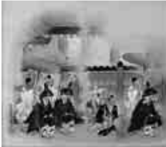
「住吉御田植女」菅楯彦画／ 綿本淡彩(昭和10年ころ)

浪華の風俗画家・菅楯彦(1878-1963)展。狩野派、四条派、浮世絵を独学で学び、中国絵画や仏教美術のほか漢学・国学にも造詣が深かったことで知られます。軽妙洒脱と評されるその作品に、古き良き大阪の情緒を、ひいては懐かしき芦屋の床の間の面影を感じ、浪華大阪が有していた趣味性の高さと、上品な文化を感じ取ってください。