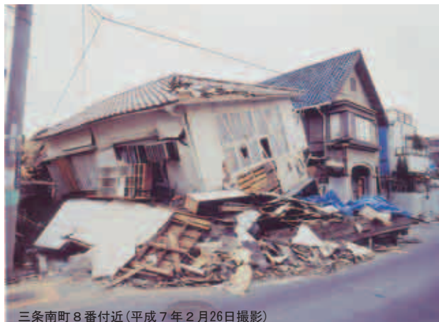
三条南町8番付近(平成7年2月26日撮影)