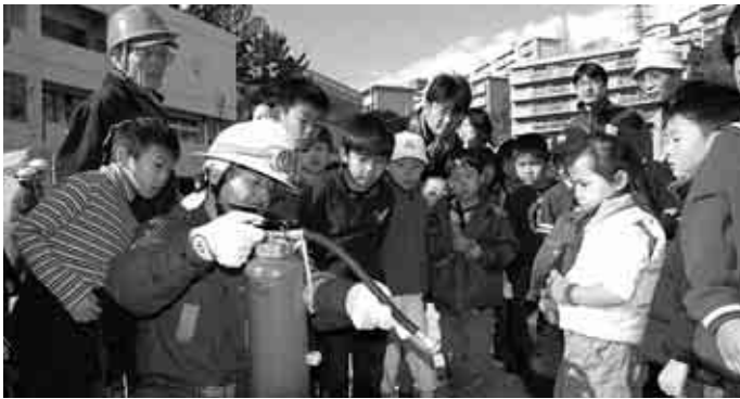
「1.17は忘れない」地域防災訓練(朝日ヶ丘小学校コミスク) 昨年12月、朝小コミスクや子どもたち・警察・消防・県民局や県防災局など約1,000人が参加し、地域防災訓練を実施しました。

発行/ 芦屋市役所(広報課) TEL.0797-31-2121 FAX.0797-38-2152 〒659-8501兵庫県芦屋市精道町7番6号 ホームページ http://www.city.ashiya.hyogo.jp/ メールアドレス info@city.ashiya.hyogo.jp