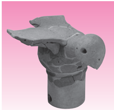
岩橋千塚古墳群(特別史跡) 大日山35号墳出土遺物・鳥形埴輪