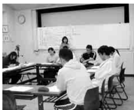
▲学校を会場とした研修講座

子どもたちの社会性の向上や確かな学力の定着を図るため、専門家による講演や具体的な演習を通して、指導力の向上を図っています。確かな理論を学び、子どもの想像力をかきたて、仲間とともに学ぶ意欲を育てるワザとコツを学んでいます。