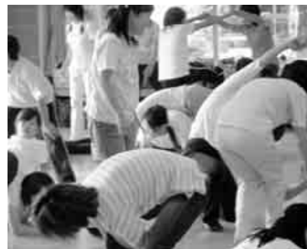
▲1学期研修講座～幼稚園研修～実技場内

現在、子どもたちをとりまく教育的課題は、社会問題となっています。そのような中で、教員全員が子どもたちの健やかな成長を促すために、子どもさまざまな行動や心理への理解、その支援や指導のあり方について研修しています。 【八月】課題別研修 ①特別支援教育の現状と課題 ②子どもの心とシグナルをめぐって ③新渡戸問題と多文化共生社会について考える 【八月】管理職研修 ①組織を活性化させる学校マネジメント ②現代の食に関する教育的課題と食育について ③新渡戸問題と多文化共生社会について考える