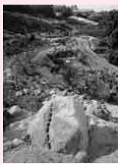
岩園の地名の由来となった石切り場の風景

東六甲の豊富な花崗岩は、良好な石材として、古墳時代後期の横穴式石室や近世徳川氏大坂城の石垣をはじめ中世石造物や近・現代の諸施設の建材や墓石などに多岐にわたって利用されました。