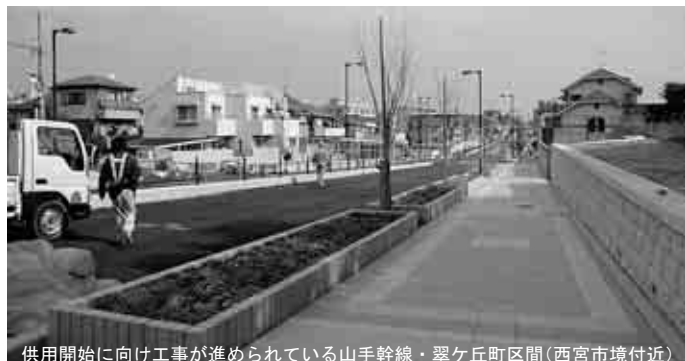
供用開始に向け工事が進められている山手幹線・翠ヶ丘町区間(西宮市境付近)