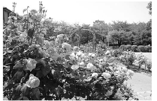
岩ヶ平公園とモンテペロバラ園

昭和36年4月開園の岩ヶ平公園は多くの桜の木が植えられ、満開ともなると公園中が桜の花で覆いつくされます。 その一隅には、アメリカのモンテペロ市との姉妹都市を記念したバラ園があり(昭和48年開設) 5月には約260株のバラが咲き誇ります。このバラは、芦屋市からモンテペロ市に送った親善友好の桜の苗木への返礼として、昭和49年にモンテペロ市の市花であるバラが送られたものです。また、昭和44年に同市から送られた「伝道の鐘」も、園内に設置されています。