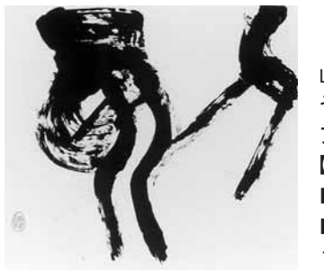
上羅芝山・書「KOKU(刻)」1992年作品

いよいよ、6月8日(日)までく月曜休館。現在開催中の「秘密のコレクション-上羅芝山・ブルデル・山田皓齋ほか-」展では、紹介される機会の少なかった館蔵品のうち、上羅芝山の書、山田皓齋の日本画、エミール=アントワーヌ・ブルデルのレリーフ小品などを展示しています。 【関連企画 担当学芸員による列品解説】 ■日時 6月7日(土)午後2時~ ■会場 美術博物館展示室 ■観覧料 一般300(240)円、大生200(160)円、中学生以下無料 *()内は20人以上の団体料金 問い合わせ 美術博物館 ☎38-5432