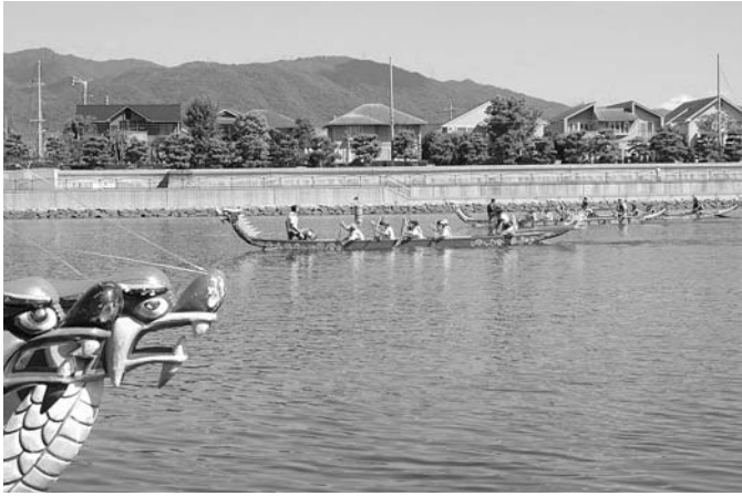
ASHIYA CUP ドラゴンボートレース大会は、7月27日(日)開催 今年、サマーカーニバルの翌週に、もう一つの夏の風物詩・ドラゴンボートレース大会を芦屋キャナルパークで開催します。

発行/ 芦屋市役所(広報課) TEL. 0797-31-2121 FAX. 0797-38-2152 〒659-8501兵庫県芦屋市精道町7番6号 ホームページ http://www.city.ashiya.hyogo.jp/ メールアドレス info@city.ashiya.hyogo.jp