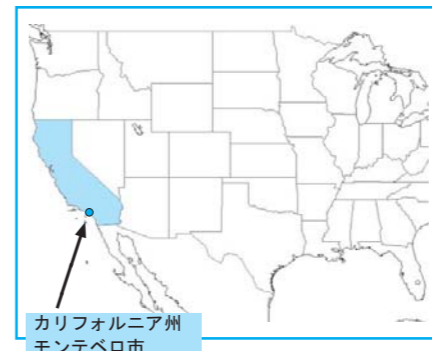
カリフォルニア州 モンテベロ市