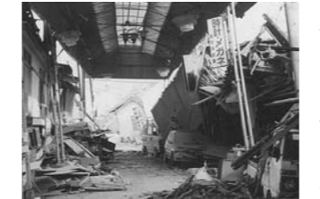
震災で壊滅状態の本通り商店街 (平成7年1月・大槻町)

市教育研究会 防災教育部 会では震災を体験していない市内の小・中学校の子どもたちへ、当時の状況や震災から学んだことを伝え、学習するための教材を作成しています。 市民の皆さんがご持ちの震災当時の写真や映像をお貸しください。また子どもたちに、震災の体験を語っていただき、語り部の募集もしています。