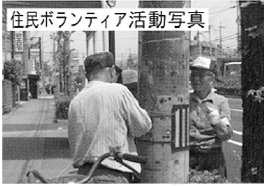
住民ボランティア活動写真

違反広告物を追放しよう! 【内容】 無償ボランティア 道路上の違反簡易広告物要綱で規定されているもので、人力で撤去可能なものを除却 市が開催する講習会を受講、活動は二人以上で、市が交付する「推進員証」を携帯し、腕章を着用、必要な道具(ニッパー、手袋等)を支給 活動中の事故に備えて、市がボランティア保険に加入 任期は認定後一年、以降は更新(申し込み) 八月二十九日金までに、都市計画課窓口にある申請書に必要事項を記入し、推進員名簿・活動計画書を添付の上、持参(市役所北館三階)または郵送(〒659-8501住所不要)で、都市計画課まちづくり・開発事業担当へ。