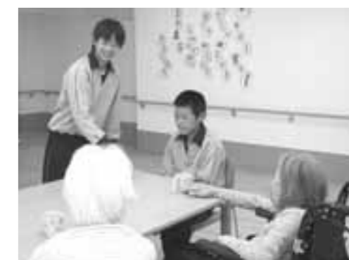
マイライフ芦屋(精道中学校)

【「みどり地域生活支援センター」での活動】 僕がトライやる・ウィークで学んだことは、仕事の大変さ、ありがとうの一言が気持ちいいということ。利用者のかたにお茶を飲ませてあげるの簡単そうに思いましたが、実際にやってみるととても難しく緊張しました。一人一人の飲み方が違うということを介護の人はすべて覚えていて、うまくやっていらしたので、すごいなあ、と思いました。利用者のかたからの、ありがとう