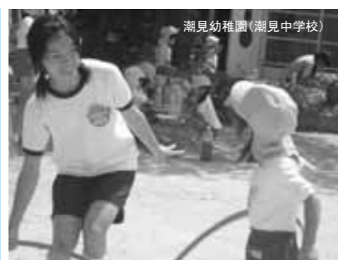
潮見幼稚園(潮見中学校)

【フラワーショップフロア】での活動 私が芦屋病院を選んだのは、迷っていたときに両親が「病院は人の命を預かる所、つらいことが多い分、やりがいはあるよ」と勧められたからです。看護師さんは、何人もの患者さんを受診しているのに、一人一人に気を配っていて、患者さんのちょっとした体調の変化にも気がついていて、すごいなあと思いました。