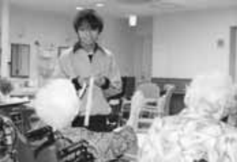
エルホーム芦屋(精道中学校)

平成20年度の「トライやる・ウィーク」で、市立3中学校および県立芦屋国際中等教育学校の生徒たちを受け入れてくださったのは、次の80事業所です。ありがとうございました。 音羽茶屋、白石、なんすい食品(市役所内食堂)、マクドナルド芦屋打出店、マクドナルドJR芦屋店、中国料理「光宏」、かごの屋芦屋店、江戸前すし竹、フラワーショップ・フロア、芦屋石油、ホワイトカープラザ東山、ウエディングヴィラ・マルキーノ芦屋、天久堂書店、ペットショップ・パナシュ、セレンティリゾート、いかり芦屋店、エビ打出店、園芸と焼き物の店・松本、倉橋商店、コープ打出浜店、コープティズ芦屋、コープ浜芦屋、セルバ・マル井、グルメシティ芦屋浜店、大丸ピーコック芦屋南宮町店、セブンイレブン潮芦屋店、軒屋、フィッシングマックス芦屋店、モンアイザー・内野惣菜店、美容室「バーティ」・Rene of Paris WASHAW、avien打出店、ウエルシア打出店、芦屋警察署、浜風小学校、潮見小学校、宮川小学校、精道小学校、消防本部、図書館、南芦屋浜病院、芦屋病院、大道具サンシャイン、朝日ヶ丘幼稚園、伊勢幼稚園、岩園幼稚園、小槌幼稚園、潮見幼稚園、精道幼稚園、西山幼稚園、浜風幼稚園、宮川幼稚園、岩園保育所、子育てセンター、精道保育所、新浜保育所、チャイルドパークあしやえん、大東保育所、あゆみ保育園、緑保育所、打出保育所、浜風夢保育園、山手夢保育園、芦屋インターナショナルスクール、ベルポート芦屋、海洋体育館、芦屋海浜公園プール、教育委員会生涯学習課文化財担当、芦屋の家、アクティブライフ芦屋、くすのきのいえ、あしや喜楽苑、みどり地域生活支援センター、エルホーム芦屋、みどり福祉作業所、三条ティサービスセンター、あしや聖徳園、アクティブライフ山芦屋、マイライフ芦屋、芦屋写真室