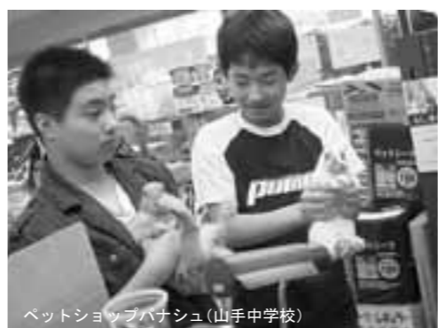
ペットショップパナシュ(山手中学校)

【「みどり地域生活支援センター」での活動】 僕がトライやる・ウィークで学んだことは、仕事の大変さ、ありがとうの一言が気持ちいいということ。利用者のかたにお茶を飲ませてあげるの簡単そうに思いましたが、実際にやってみるととても難しく緊張しました。一人一人の飲み方が違うということを介護の人はすべて覚えていて、うまくやっていらしたので、すごいなあ、と思いました。利用者のかたからの、ありがとう