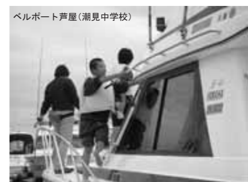
ベルポート芦屋(潮見中学校)

失敗して落ち込んでいたときに、事業所のかたに優しい言葉をかけていただいたりすると、心が晴れる。同時に「よしっ！次は、もっとなんか」と思えました。見た目はきれいな花ですが、きれいに育てるために、手入れをせたり水換えをせたりする大切さを教えていただきました。事業所のかたが、ご指導いただき、ありがとうございます。 (細川光男 潮見中学校)