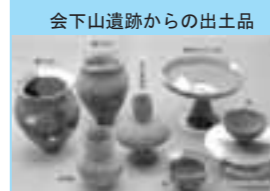
会下山遺跡からの出土品

【「芦屋喜楽苑」での活動】 ある時、僕が車いすを押すことになりました。カーブを曲がる時には、車いすを持ち上げなければいけなくなりました。かなり重さがあり、僕も乗っているかたも、あたふたしてました。すると、女性の職員のかたが手伝ってくれました。職員のかたは、相手にあつた対応名前や住んでいる所を完璧に覚えていらつやいました。僕は、それが