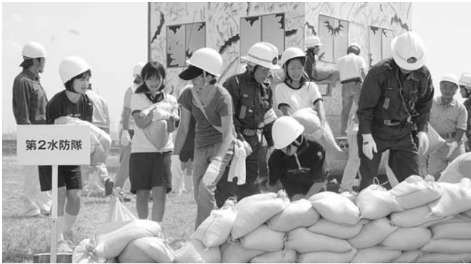
地域の皆さんとともに、「防災総合訓練」を実施しました 9月7日(日)南芦屋浜地区のフリーゾーンで、防災関係機関と地域住民とが連携、災害から命と財産を守るための訓練を実施しました。

発行/ 芦屋市役所(広報課) TEL. 0797-31-2121 FAX. 0797-38-2152 〒659-8501兵庫県芦屋市精道町7番6号 ホームページ http://www.city.ashiya.hyogo.jp/ メールアドレス info@city.ashiya.hyogo.jp