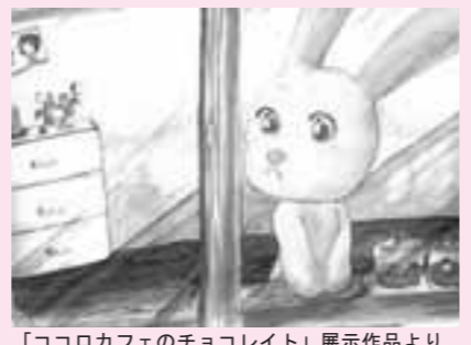
「ココロカフェのチョコレート」展示作品より