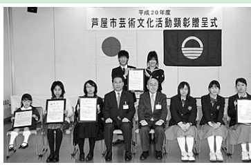
芸術文化活動顕彰贈呈式