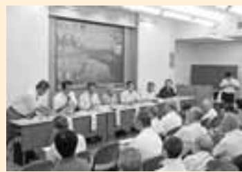
シンポジウムの光景

芦屋市の職員からは、大坂城の築城石を採石した石切場の調査は、全国的で最も早くに着手され、六甲の調査成果が、江戸城伊豆石切場をはじめ各地の石切場の発掘調査に多くのヒントを与えたことなど、大坂城と芦屋の深い関係に話を及ぼしました。