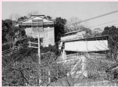
修復中の旧山邑家住宅 (平成7年~10年)

小字名の山坂・笠ヶ塚・奥山の一部などが昭和十九年(一九四四)一月に山手町となりました。昭和九年に開校した村立山手小学校現山手小学校の「山手」の文字をとってつけられたともいわれています。町内には奥山・有馬につながる芦有道路が走り、精道奥山線に沿った急坂にアメリカの建築