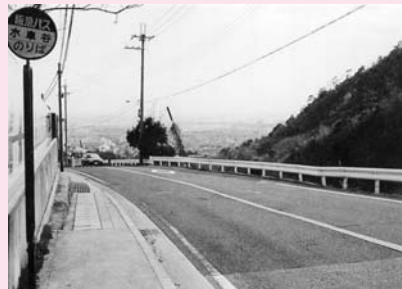
奥池浄水場前に立つ「水車谷」のバス停

奥山には、芦屋市民の大切な水源のある奥山浄水場や、むかし精米や油しぼりのため水車が動いていた水車谷や、弁天岩・フカキリ岩・蛇谷・荒地山などの伝説の地、ナウマン象化石出土地、奥山刻印群などの文化財。美しい渓谷、貴重な植物・生物が見られます。