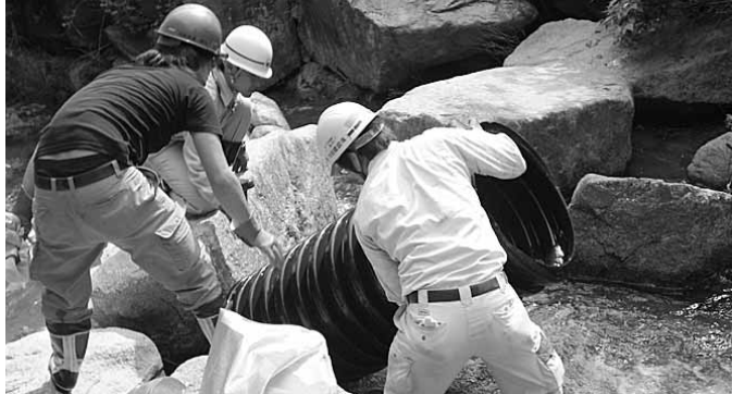
6月4日、芦屋川上流で「水道水源保全大作戦」を実施 本市の貴重な水資源を守るため、芦屋川上流約3kmの清掃作業を実施し、不法投棄されたタイヤ等570kgを収集しました。

発行/ 芦屋市役所(広報課) TEL. 0797-31-2121 FAX. 0797-38-2152 〒659-8501兵庫県芦屋市精道町7番6号 ホームページ http://www.city.ashiya.lg.jp/ メールアドレス info@city.ashiya.hyogo.jp