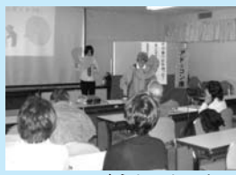
くらしのセミナー