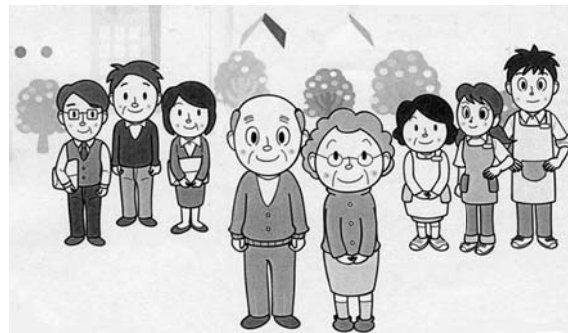
まわりの見守りが、高齢者の消費者トラブルを防ぎます