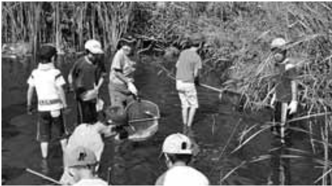
総合公園ビオトープでの「生き物観察会」 10月2日(土)水を抜いたビオトープの生き物 ニシキゴイ・エビ・ザリガニほか観察会に、17組・37人の親子が参加しました。

発行/ 芦屋市役所(広報課) TEL. 0797-31-2121 FAX. 0797-38-2152 〒659-8501兵庫県芦屋市精道町7番6号 ホームページ http://www.city.ashiya.lg.jp/ メールアドレス info@city.ashiya.hyogo.jp