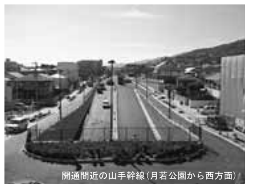
開通間近の山手幹線(月若公園から西方面)

通行規制に伴って、国道2号には車が集中し、その渋滞により救援物資の搬送にも支障の出るような状況でした。