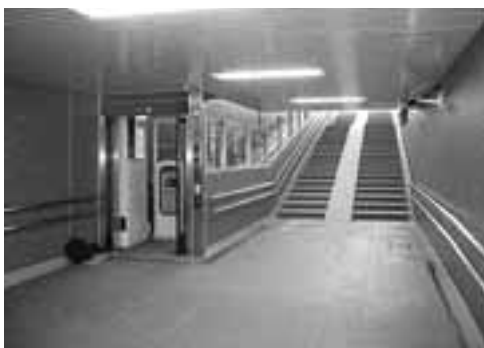
斜行型エレベーターで、月町町と松ノ内町を結ぶ地下歩道

■山手幹線の概要 山手幹線は、戦災からの復興を目指し、昭和二十一年五月に都市計画決定された道路で、尼崎市から神戸市長田区までを結び、総延長約二十九・五キロメートルの幹線道路です。震災までに、約二十四キロメートルが供用されていましたが、残りの約六キロメートルは未開通で、各区間の整備には、本市をはじめ、神戸・西宮・尼崎の