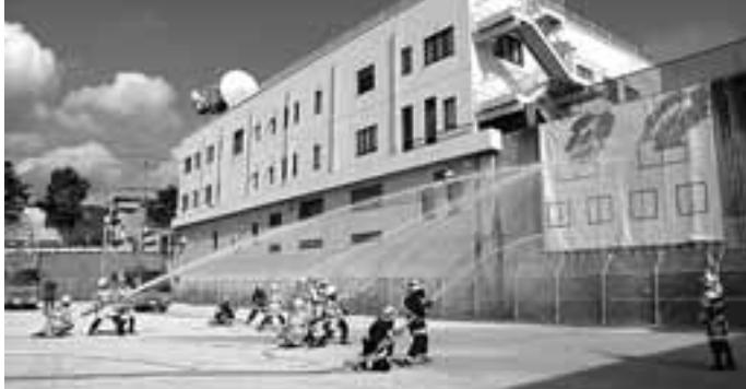
「平成23年 芦屋市消防出初め式」を開催 1月9日(日)、体育館・青少年センターと川西運動場を会場に、 式典および一斉放水訓練・初期消火訓練等を実施しました。

発行/ 芦屋市役所(広報課) TEL. 0797-31-2121 FAX. 0797-38-2152 〒659-8501兵庫県芦屋市精道町7番6号 ホームページ http://www.city.ashiya.lg.jp メールアドレス info@city.ashiya.hyogo.jp