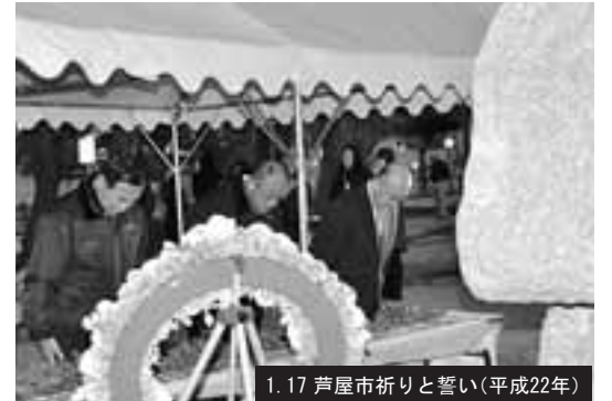
1.17 芦屋市祈りと誓い(平成22年)