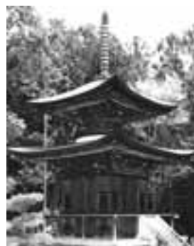
国宝 慈眼院多宝塔