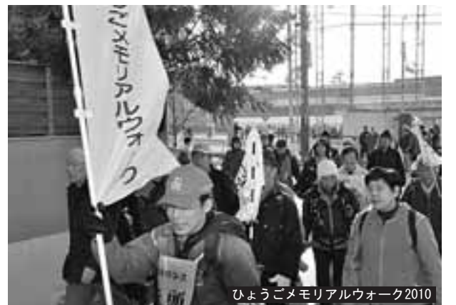
ひょうごメモリアルウォーク2010

問い合わせ ひょうご安全の日推進県民会議事務局 ☎078-362-9984/FAX 078-362-9876