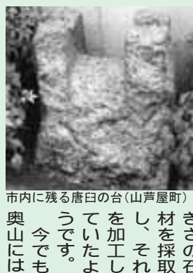
市内に残る唐臼の台(山芦屋町) 奥山には、

本市は、昭和十五(一九四〇)年に市制を敷きましたが、大正時代以降、阪神郊外の一農村から全国屈指の住宅都市へと発展してきました。その間には、昭和十三年の阪神風水害や同二十年の空襲、さらには平成七年に発生した阪神淡路大震災などの災害により、見慣れた景観が一瞬にして失われ、急激に変貌したこともありました。