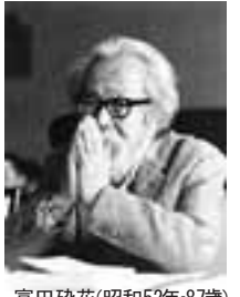
富田碎花(昭和52年-87歳)

富田碎花(昭和52年-87歳)の詩集を募集します。対象は平成22年7月~23年6月末までに発行された詩集(翻訳・アンソロジー・復刻・遺稿詩集等は除く)。賞・賞金 正賞・賞状/副賞50万円。応募方法 詩集2冊(返却不可)を、7月29日(金)<消印有効>までに、氏名・住所・電話番号を明記し、下記へ郵送してください。