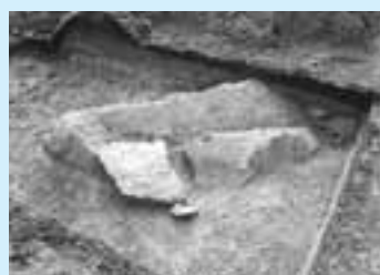
朝日ヶ丘遺跡でみつかった新田開発に伴う割石

ように台地上までが対象となって、芦屋川左岸を中心に三百四十石余の新田が開かれました。このような新田開発の痕跡が、縄文時代前期の遺跡として知られる朝日ヶ丘町の朝日ヶ丘遺跡で見つかっています。平成十七年に実施した発掘調査では、尾根の高い部分を削り取り、谷に臨む低い部分に、十六世紀後半、十八世紀の瓦や陶磁器片を含む土を「メートルほど盛り上げて、平らな水田を作っている様子」が確認できました。