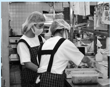
音羽茶屋芦屋店で(精道中学校)