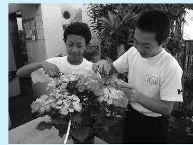
フラワーショップフロラで(山手中学校)