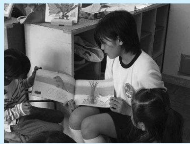
緑保育所で(潮見中学校)