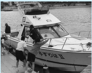
県立海洋体育館で(精道中学校)

★平成24年度に、新たにトライやる・ウィークの受け入れをお考えの事業主のかたは、学校教育課(☎38-2087)までお知らせください。