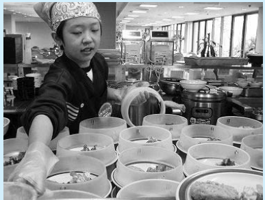
芦屋市役所食堂で(潮見中学校)

私の今回のトライやる・ウィークの目標は、「笑顔・マナー・気配り」でした。ふだん私が足りないと思うところを、このトライやる・ウィークの目標として決めました。美容院は接客なので、学ぶことはたくさんありました。その中でも一番学んだことは、心づかい、気配りが何よりも必要だということです。スタッフは毎朝早くから店内の掃除をして、お客様と接するときはいつも笑顔を保ち、会話がはずむように話していました。そして、どのお客様にも気配りを忘れませんでした。また普段できない体験をいくつかさせていただきました。シャンプー体験もその一つです。相手と一緒にトライやる・ウィークをしていた人なので、かなり緊張しました。気持ちいいようにと思ってしっかり洗いました。相手は気持ちよかったです。気持ちいいようにと思ってしっかり洗いました。相手は気持ちよかったです。気持ちいいようにと思ってしっかり洗いました。相手は気持ちよかったです。