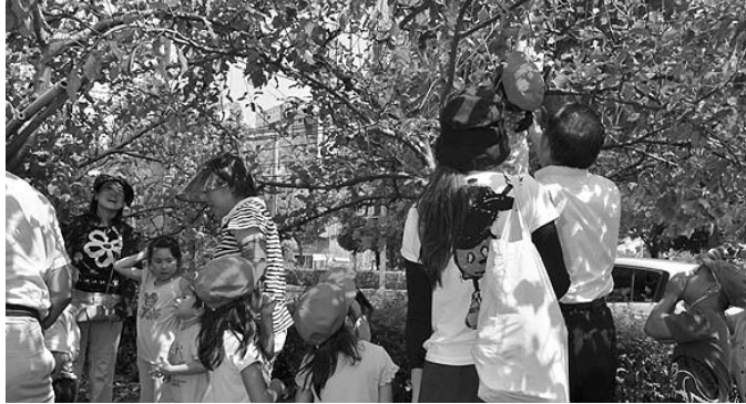
今年もたくさんの「希望りんご」を収穫しました 8月12日(金) 近隣の住民や保育所園児など81人が参加し、今年で10回目となる「希望りんご収穫会」が開催されました。

発行/ 芦屋市役所(広報課) TEL. 0797-31-2121/FAX. 0797-38-2152 〒659-8501兵庫県芦屋市精道町7番6号 ホームページ http://www.city.ashiya.lg.jp/ メールアドレス info@city.ashiya.hyogo.jp