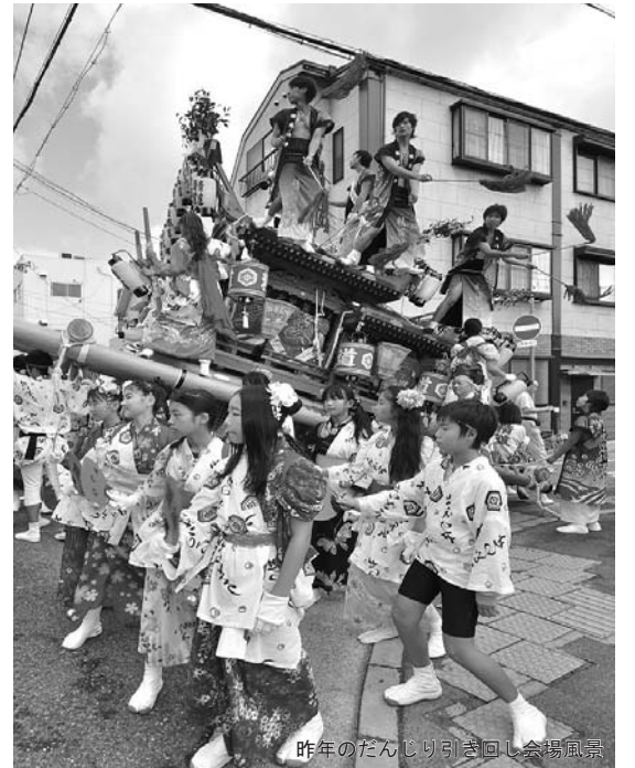
昨年のだんじり引き回し会場風景

今年も、だんじり巡行・吹奏楽・パレード・縁日や物産店・バンド演奏など、盛りだくさんのイベントが予定されています。秋の一日、ご家族そろって、秋まつりにご参加ください。 ■日時 十月九日(日)午前九時～午後三時 少雨決行・荒天中止 市ホームページでご確認ください。 ■会場 精道小学校グラウンド・東側道路 秋まつり開催中は、精道小学校東側道路は車の通行が規制されます。駐車場はありませんので、車での来場はご遠慮ください。