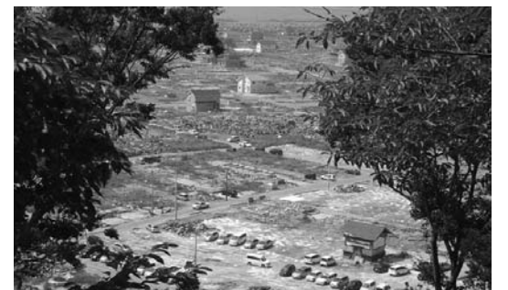
日和山公園から見た8月現在の南浜(石巻市)