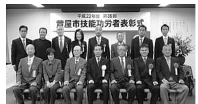
平成23年度技能功労者の皆さん

三十年以上にわたり同一の職種に従事し、優れた技能で社会に貢献された市内在住の次の五職種・六人の技能功労者の皆さんを、十一月十八日(金)、市民センターにおいて表彰