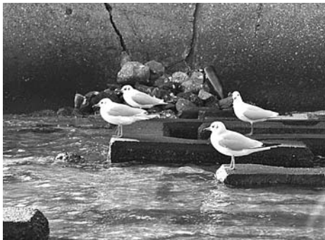
冬の芦屋川河口付近