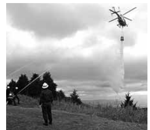
平成21年度に実施した「林野火災防ぎょ訓練」の様子