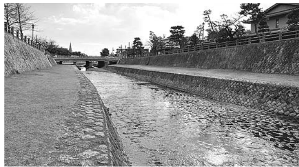
業平橋から見た公光橋方面の芦屋川の景観

市役所/保健福祉センター/打出教育文化センター/市民センター/図書館/美術博物館/芦屋病院/消防本部/体育館・青少年センター/総合公園/環境処理センター/あしや市民活動センター/芦屋市消費生活センター/男女共同参画センター/上宮川文化センター/みどり地域生活支援センター/潮芦屋交流センター/市内地区集会所/市立幼稚園/市立保育所/養護老人ホーム和風園/三条デイサービスセンター/霊園事務所//芦屋健康福祉事務所