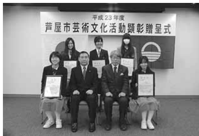
芸術文化活動顕彰贈呈式