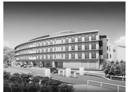
芦屋病院新病棟(東側道路から見た)完成予想図

芦屋病院では、平成22年から建築を進めていた新病棟、併せて行われている外来棟、管理棟の全面改修工事が完了し、6月15日(金)にリニューアルオープンを迎えます。新病棟披露として、下記のとおり内覧会を開催します。皆様のご参加をお待ちしています。