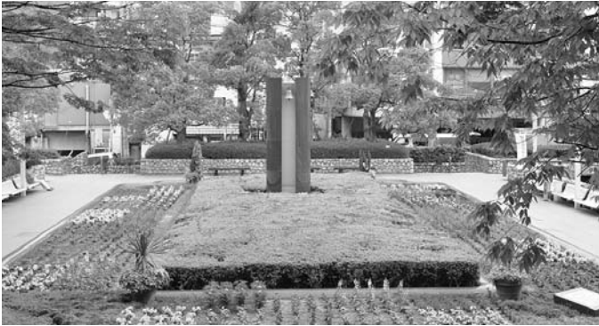
市役所北広場花壇の花を植え替えました 6月9日(土)市民の皆さんのお手伝いでマリーゴールドやサルビアに植え替えられ、花壇は夏の彩りに変わりました。

発行/ 芦屋市役所(広報課) TEL. 0797-31-2121/FAX. 0797-38-2152 〒659-8501兵庫県芦屋市精道町7番6号 ホームページ http://www.city.ashiya.lg.jp/ メールアドレス info@city.ashiya.hyogo.jp